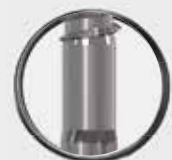
7 mm gewindefreier Teil hinter der Bohrspitze