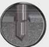
Bohrspitze bohrt sich währenddessen durch Bauteil 2.