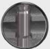
Gewindefreier Teil dreht in Bauteil 1 durch.